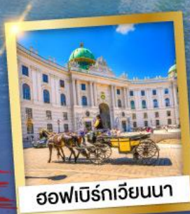
ออฟเบิร์กเวียนนา