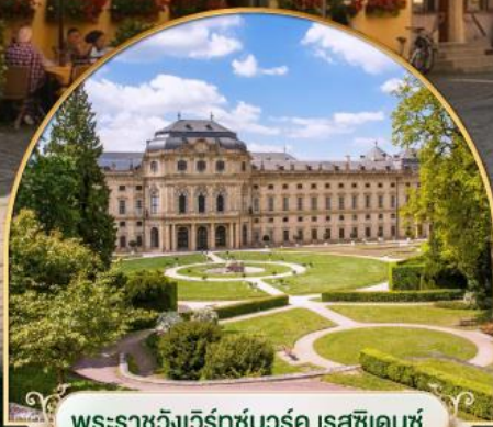
พระราชวังแวร์ซายส์ ฝรั่งเศส