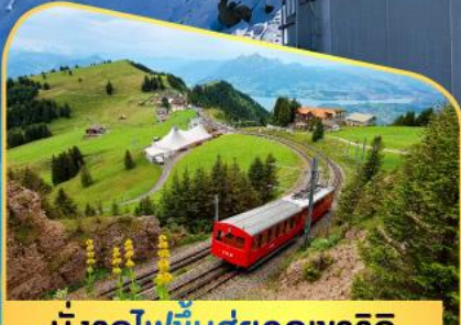
นั่งรถไฟขึ้นสู่ยอดเขาโรสิ