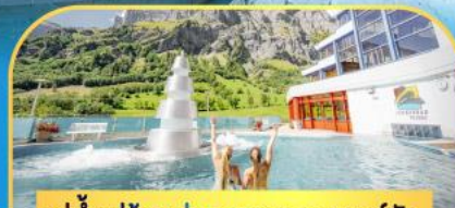
แช่น้ำแร่ร้อนฟ่อนคลายลวยคอร์นัค