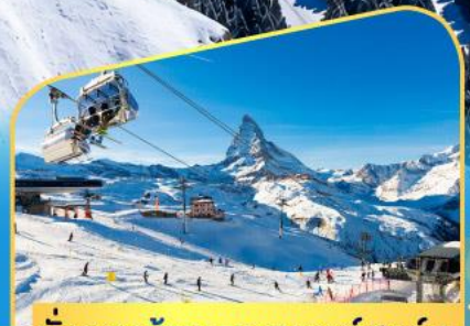
นั่งกระเช้าชมแมทเทฮอร์น