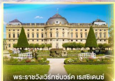
พระราชวังแวร์ซายส์บวร์ค เรสซิเดนซ์