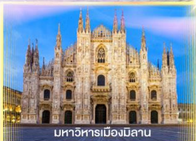
มหาวิหารเมืองมิลาน