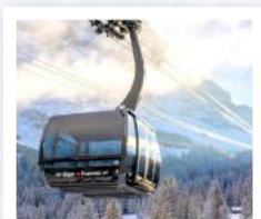
ขึ้นกระเช้ายอดเขาจุงเฟรา