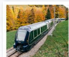
รถไฟโกลเดนพาส