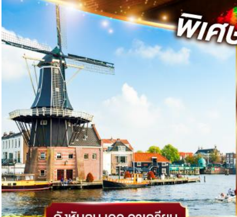
กังหันลม เดอ อาเดรียน