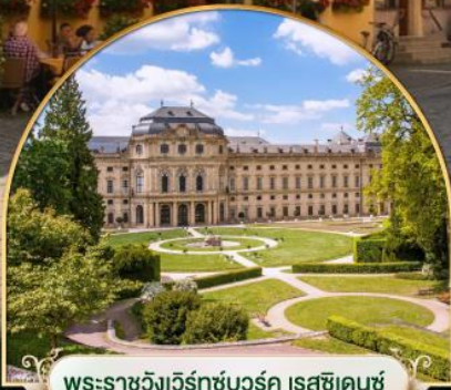
พระราชวังเวิร์ทซบวร์ค เรสซิเดนซ์