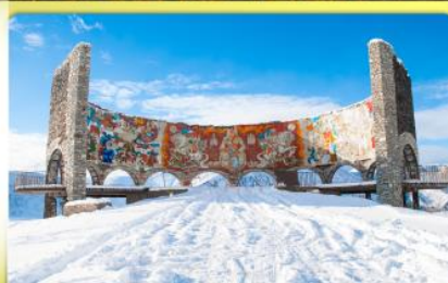
อนุสรณ์สถานรัสเซีย