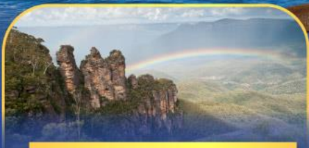
อุทยานแห่งชาติบลูเมาท์เทนส์ Three Sister Rock