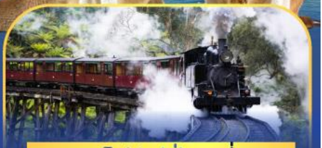
รถไฟพั้งบิลลี่

ล่องเรือชมอ่าวซิดนีย์พร้อมรับประทานอาหารกลางวัน และ เข้าชมสวนสัตว์การองเก้า